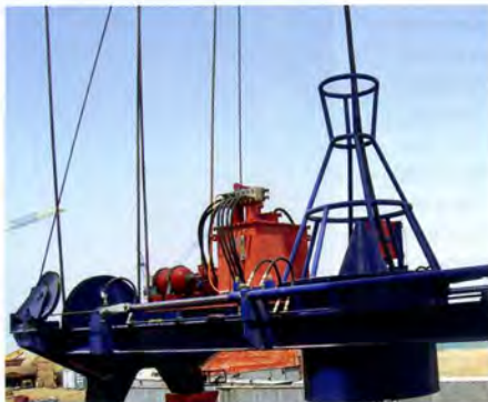
Hydraulische Lastpendeldämpfung an einem RTG-Kran: das Hydraulikaggregat mit Steuerblock und die einfach wirkenden Hydraulikzylinder sind auf dem Spreader installiert

Am Beispiel des Be- und Entladens eines Containerschiffs lassen sich die Pendelgesetze für Fortgeschrittene gut erklären: Bei den Ship-to-Shore-Kranen (STS-Krane) mit einer Brückenhöhe von 50 m kann ein Container bis zu 8,50 m ausschlagen und benötigt für eine Amplitude bis zu 8 s. Aus der Sicht der Umschlagbetriebe, Schiffseigner und Hafengesellschaften ist das aber ein äußerst ärgerliches Phänomen. Denn das Pendeln der Container hat Verzögerungen bei den Ladevorgängen zur Folge: Der Kranfahrer muss warten, bis der Container ausgeschwungen ist und zentimetergenau positioniert werden kann. Da im Hafen jede Minute buchstäblich Geld kostet, sind immer wieder Versuche unternommen worden, das Lastpendeln von Containern zu dämpfen bzw. zu unterbinden. So wurden z. B. elektronische Systeme entwickelt,