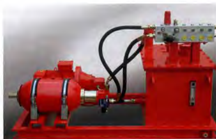
Für die jeweiligen Seilvorspannungen werden die erforderlichen Drücke eingestellt: Hydraulikaggregat mit Steuerblock

bei denen eine mitfahrende Kamera die Pendelbewegungen erfasst und eine Regelelektronik Gegenbewegungen veranlasst. Diese Systeme sind jedoch aufwändig und – vor allem unter widrigen Umgebungsbedingungen – sehr wartungsintensiv.