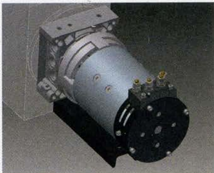
Das hydraulische Unterflur-Powerpack ist kompakt gebaut; der Ventilblock besteht aus Standardkomponenten.

derzeuge benötigt werden. Die Querförderbänder des Transportanhängers sorgen somit für einen geordneten Materialfluss. Angetrieben werden sie hydraulisch. Ruppel Hydraulik konstruierte dazu ein Powerpack, das sich als Unterflureinheit platzsparend unterbringen lässt und unter anderem den Vorteil bietet, dass es auf kompaktem Raum die hohe Leistung aufbringt, die beim Anfahren der mit 1,5 Tonnen Last beladenen Förderbänder benötigt wird. Für das Betätigen des Antriebs nutzt der Bediener ein Steuerpult, das an der Stirnseite des Plattformwagens angebracht ist.