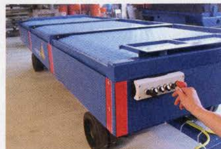
Über das Bedientableau an der Stirnseite des Wagens steuert der Bediener alle Bewegungsabläufe.

stehen und die ein halbautomatisches Be- und Entladen ermöglichen. Der Bediener kann zum Beispiel den Schlepper mit den Anhängern parallel zu einer Aufgabestation oder einem Förderband positionieren und eine Palette im Quertransport auf das Band fördern, ohne dass separate Flurför-