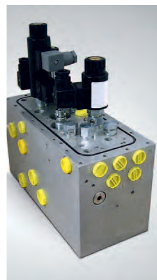
Hydraulik unter Wasser: Dieser Block steuert die Bohreinheit eines Forschungsschiffes, das Proben in 2500 m Wassertiefe entnimmt.