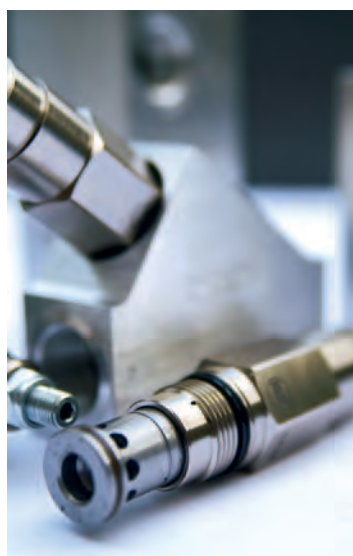
Bei der Auswahl der Einschraubventile kann Ruppel Hydraulik auf ein außerordentlich breites Programm zurückgreifen, mit dem sich auch spezielle Anforderungen in die Praxis umsetzen lassen.